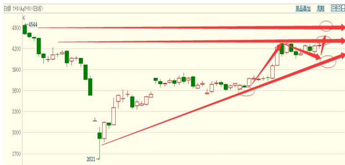
白银 TD 日线图

从日线图表观察来看，白银走势强于黄金，本轮未出现深幅回踩，以高位震荡形式来消化抛压，未来有望再迎来一波上行。白银压力：17.6、18（4300、4400），支撑：17、16.7（4150、4050）。