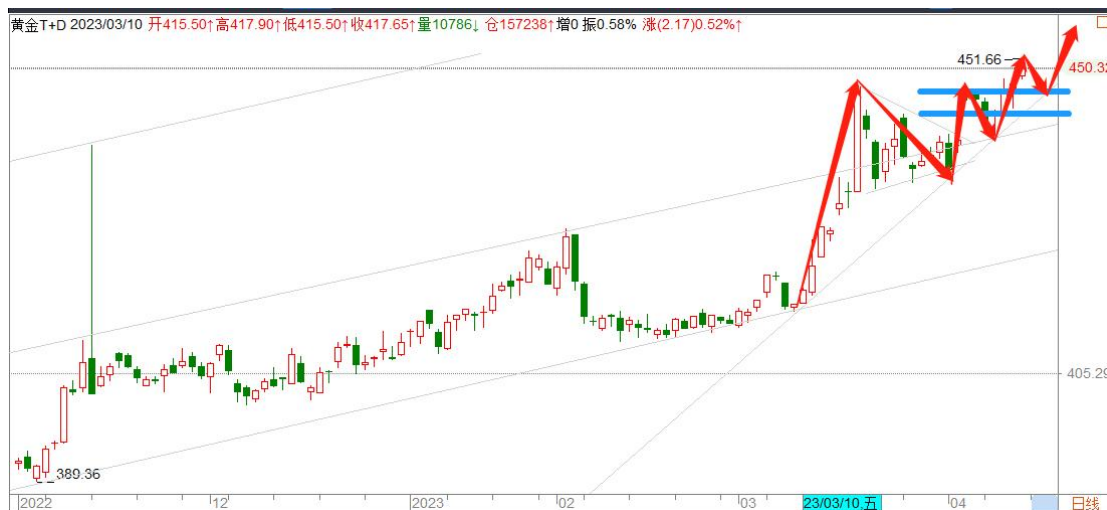
黄金 TD 日线图

黄金 TD 突破三角形回抽确认后再创新高，形成旗形结构，各周期上涨结构保持完好，以 2015（444）为短期多空分界点继续看涨。由于积累了大量的获利盘，警惕随时可能出现的技术性调整，严格止损。