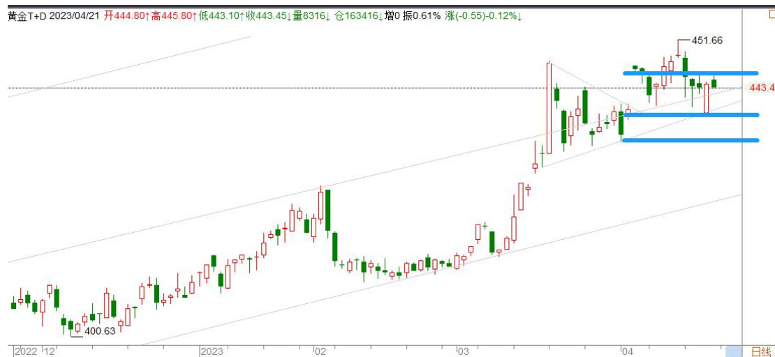
黄金 TD 日线图

黄金 TD 形成旗形后没能走出相应的涨幅，反而跌回三角形区域，旗形宣告失败，预计回归宽幅震荡。关注 445.80-440 区间。