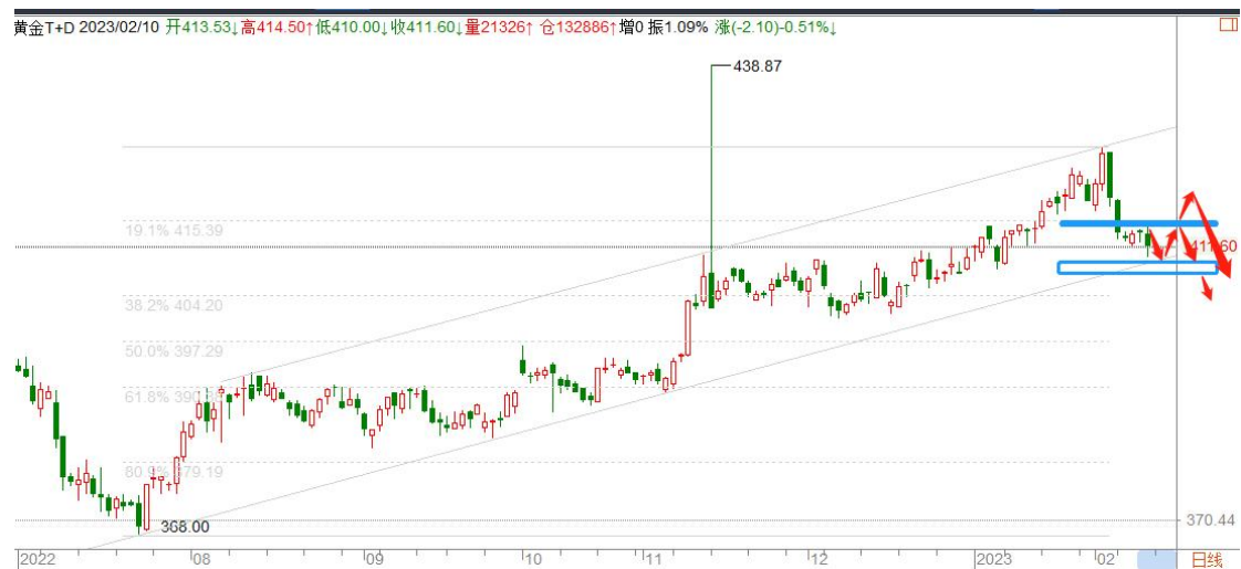
黄金 TD 日线图

黄金调整头部基本确定，目前临近关键支撑 1830（408）一线，也是回调的第一目标，预计将有较大级别的反弹，整体调整还未结束，反弹后仍将继续下跌。短线以 1890（414.60）为多空分界点继续看空。