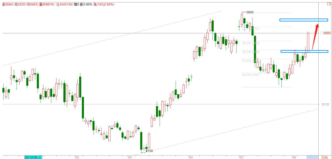
白银 TD 日线图

白银 TD 强行突破 5550 压力，进入前期密集成交区并大幅拉升，显示多头极其强势，有重启升势的嫌疑，可以 5520 为中期多空分界点继续看涨。