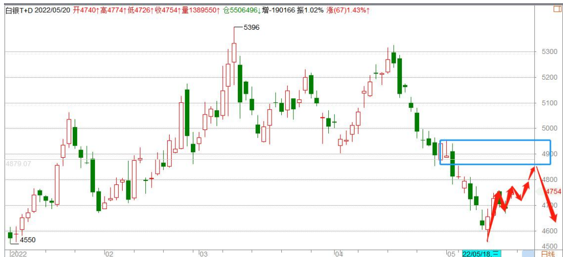
白银 TD 日线图

白银 TD 在前期低点 4550 区域得到支撑, 展开 V 型反弹, 小型底部基本确定, 短期维持低多策略, 注意把握节奏, 谨慎追高。目前的上涨暂定义为反弹, 中期方向依然偏空。