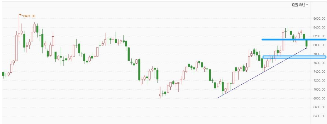
白银 TD 日线图

白银 TD 受阻于 8400，日线形成新的下跌结构，但周线上涨结构完好，有可能展开日线级别的调整，短线可尝试高空，保守的等待新的买入信号。