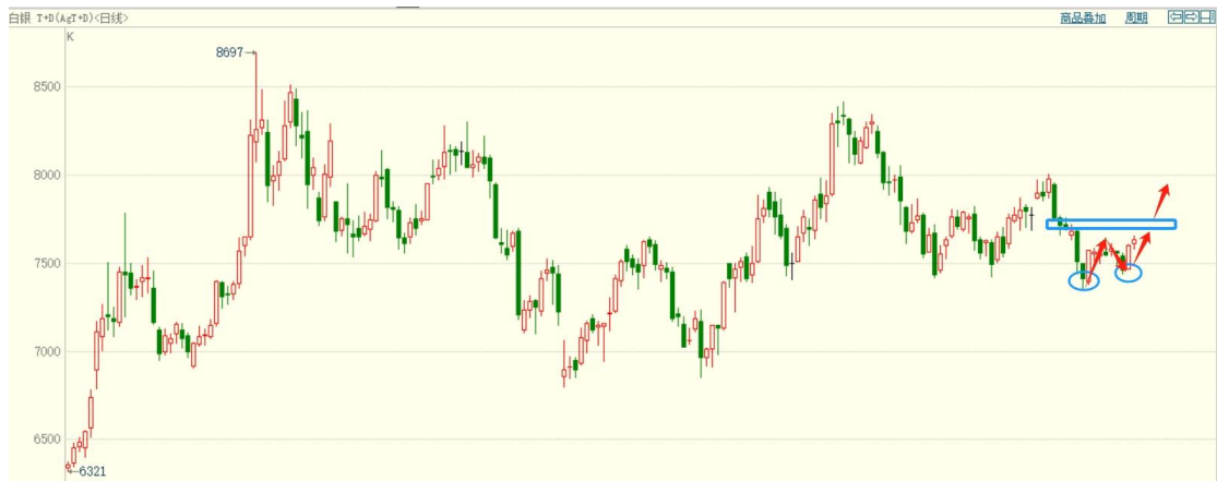
白银 TD 日线图

白银 TD 在 7350，7450 构建两个低点，日线形成新的上涨结构，虽未站上多空分界点 7700 上方，从结构上看偏向上破，激进的可尝试逢低做多，次低点止损。